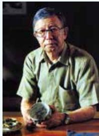
人間国宝 六代 加藤卓男