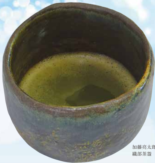
加藤亮太郎 織部茶盃