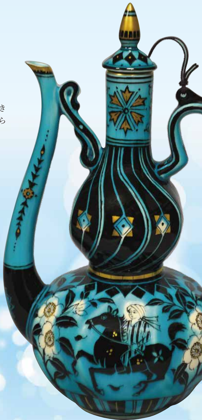
七代加藤幸兵衛 淡青袖騎馬人物文仙蓋瓶